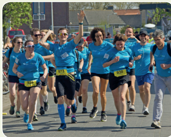
Zorg in beweging tijdens de marathon Zeeuws-Vlaanderen.

De dag van de marathon was onverwacht warm. Dat deed niet af aan het plezier van de deelnemers die dag. De sportieve prestatie vloeide voort uit de succesvolle samenwerking tussen de huisartsen en de orthopeden tijdens het meekijkconsult orthopedie. In totaal drie teams liepen warm voor de estafetteloop en zetten zich in voor deze teamprestatie buiten werktijd.